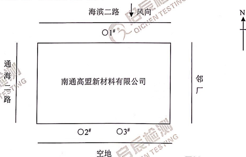
附: 无组织排放废气检测点位示意图